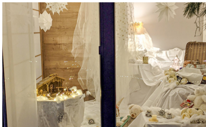
Die 5 - Familie Bayer hatte ihr Gästezimmer dekoriert und alle paar Tage neu gestaltet