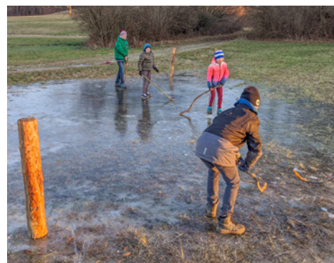
Kinder beim Eishockeyspielen in Perchting

Alle anderen Ausgaben können Sie wie immer unter TSV-Perchting.de nachlesen.