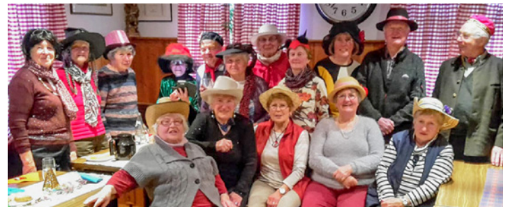
Fasching beim Seniorennachmittag