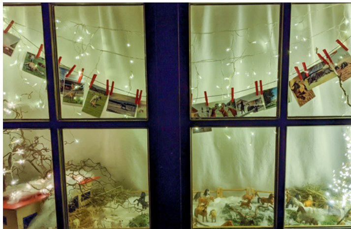
Die 11 - Ihren Pferde-Hof im Kleinformat bot uns die Familie Seethaler