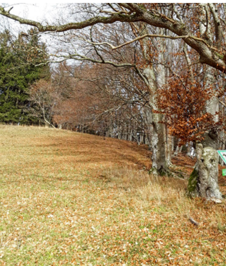
Der steile Aufstieg auf den Galgenberg

Ich starte am Findling nahe der Unterführung an der neuen Umgehungsstraße. Über einen Trampelpfad gelange ich an den Wiesenhang, folge dem alten Hohlweg, biege am Waldrand links ab und steige hinauf zwischen den Buchenstämmen. Dichtes Wurzelwerk erleichtert den steilen Aufstieg. Oben an-