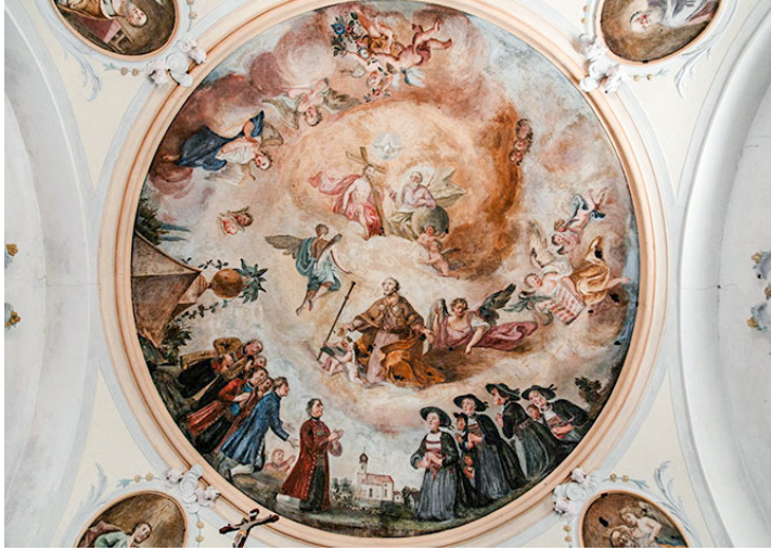
Nach neueren Untersuchungen stammen die Deckenbilder von Wenzel Albert

Das beeindruckende Deckenfresko zeigt die Landstettener „Dorfbewohner mit Originaltracht beim Bitten um Fürsprache des Jakobus“, erklärt sie. Finanziell war die Kirche durch die Lage am Pilgerweg von München nach Andechs früher gut versorgt.