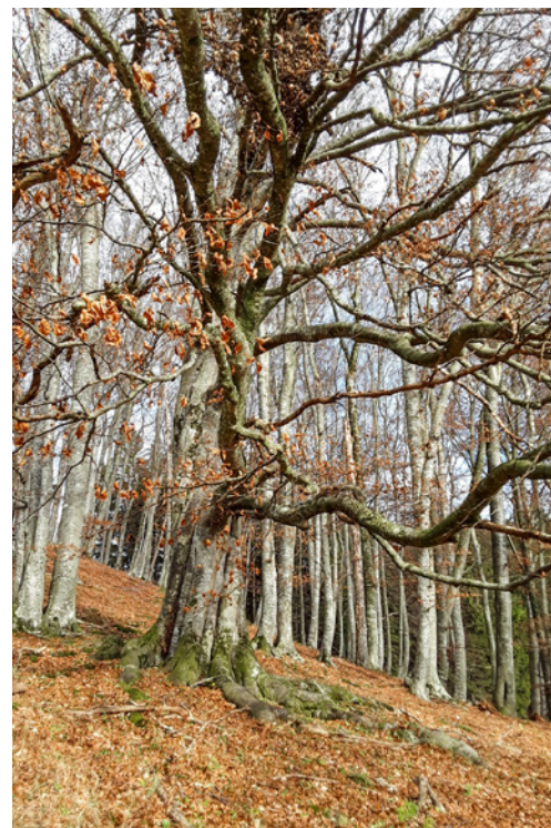
(gw) Die Buchenkönigin - was sie wohl verbirgt?

Bevor ich mich auf den Heimweg mache, besuche ich die Buchenkönigin. Ganz unten versteckt sie sich hinter ihren ausladenden Ästen. Gemütlich setze ich mich auf eine der mächtigen Wurzelarme. Es ist einfach, sich vorzustellen, dass hier Zwerge und Elfenwesen ihr zu Hause haben. Dieser liebevolle Anblick nimmt dem Namen des Ortes seine Bedrohlichkeit. Ob hier tatsächlich eine Richtstätte war – dafür gibt es keine Be-