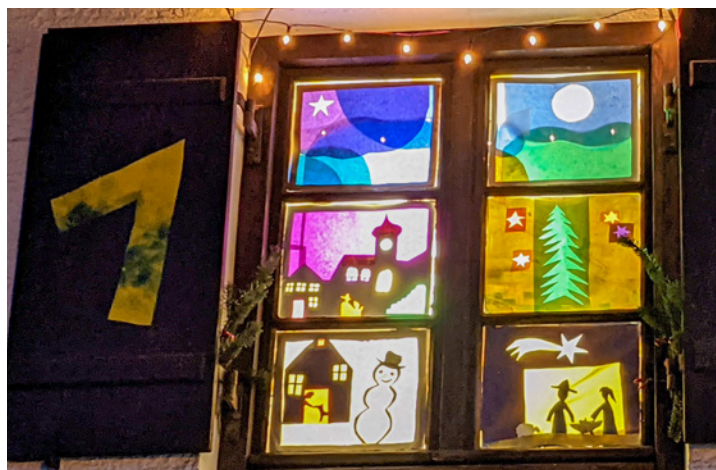
Die 1 - Winterliche und weihnachtliche Motive von Familie Huber