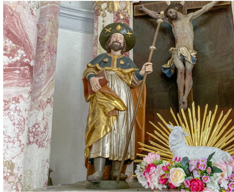
Statue des Apostels Jakobus auf dem Altar

noch die dicke Wand am Eingang, weiß Maria Müller, die gute Seele der Kirche. Auch einige Figuren aus der alten Kirche sind noch erhalten. „Die gleichen Figuren habe ich auch im Dom von Passau gesehen“, erzählt Maria Müller. Die wohl wertvollste Ausstattung ist der Hochaltar aus Stuckmarmor in Triumphbogenarchitektur. Dort findet sich auch eine Skulptur des St. Jakobus mit Wanderstab und Muschel.