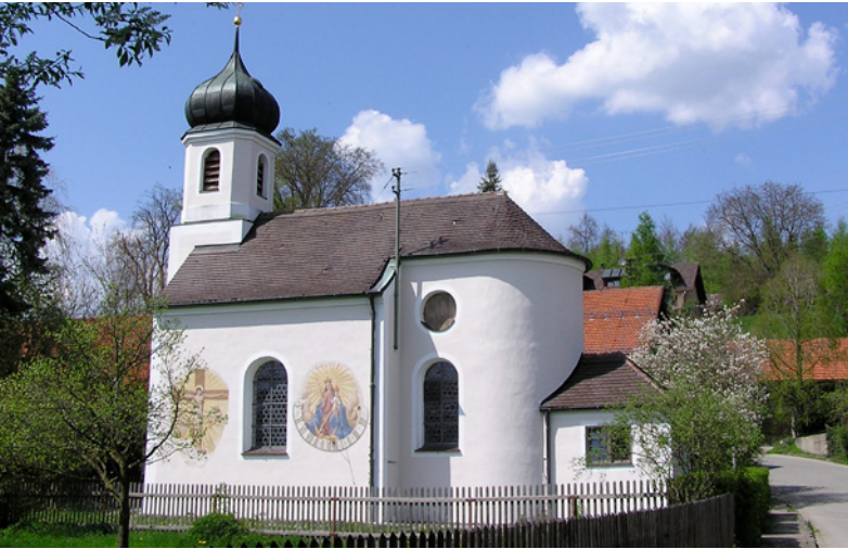
Außenansicht der Kirche St. Jakobus Major

Im letzten Teil über die Kirchen unserer drei Ortsteile widmen wir uns der Geschichte der Landstettener Kirche St. Jakobus Major, benannt nach dem gleichnamigen Apostel „Jakobus“. Auch hier wird auf Wunsch eine Führung angeboten.