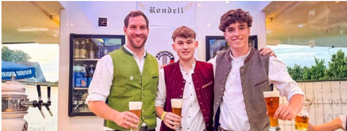
Team Weißbierwagen 2025