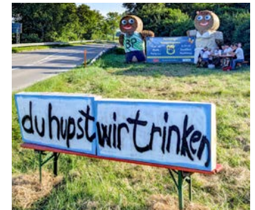
Eine Riesengaudi hatten alle bei der Ihr hupt, wir trinken Aktion

Die spontane Zusammenkunft sorgte vor dem zweiten Gruppenspiel der deutschen Nationalmannschaft für jede Menge Spaß – bei den Teilnehmenden ebenso wie bei den vorbeifahrenden Autofahrern. Sobald ein Auto hupte, sprang die Gruppe auf und reckte Flasche oder Glas fröhlich in Richtung Straße. Manch einer fand die Aktion offenbar so gelungen, dass er gleich mehrfach vorbeifuhr – der Rekord soll bei rund zehn Durchfahrten gelegen haben. Auch die Perchtinger Feuerwehr ließ sich den Spaß nicht nehmen und beteiligte sich an der fröhlichen Huperei. Ob der launige Nachmittag am Ortseingang tatsächlich für mehr Gäste beim Festwochenende sorgen wird, bleibt abzuwarten. Sicher ist aber: Die Beteiligten hatten einen Riesenspaß – und die „Strohmannschgerln“ vermutlich selten so viel Verkehr vor der Nase. Das männliche „Mannschgerln“ soll drei Tage später sogar kurzzeitig seinen Kopf verloren haben. (sf)