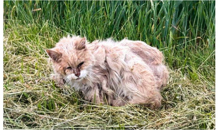
Das ist weder ein Schaf noch ein Hase, sondern eine Katze