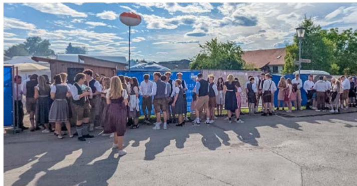
Groß war der Andrang vor dem Stadtfest im letzten Jahr

Ob Cosmic Music oder Elektro, Konzert oder Kabarett – viele Ideen lagen auf dem Tisch. Am Ende fiel die Entscheidung auf eine Wiederauflage der Malle-Party, die im vergangenen Jahr erfolgreich Premiere feierte. Am 10. Juli sind ab 19 Uhr alle Gäste herzlich eingeladen, gerne im passenden Malle-Look zu kommen. Neben dem klassischen Sangria-Eimer darf natürlich auch die gute Laune Musik nicht fehlen, die man von der spanischen Insel kennt. Am Samstag geht es dann wie gewohnt mit dem Stadtfest weiter. „The Mercuries“ gehören in Perchting längst zum festen Inventar und werden auch diesmal wieder