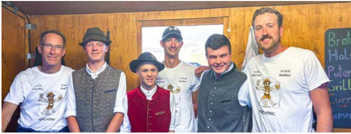
Team Grill ist bereit für den nächsten Ansturm