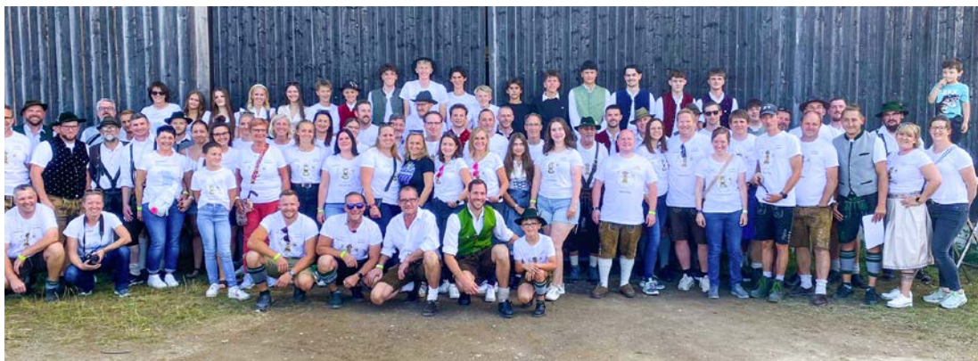
Wie in Hadorf hilft auch in Perchting gefühlt das halbe Dorf mit