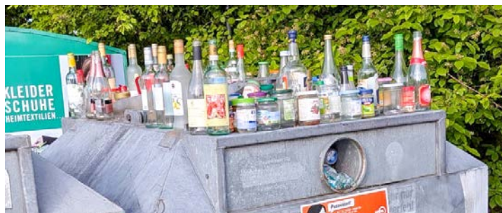
So sah es kürzlich an der Wertstoffinsel an der Ecke Römerstraße/ Andechser Straße in Perchting aus

Zwischen den Altglascontainern und dem Sammelcontainer für Alttextilien lagen neben zusätzlichen Flaschen auch eine ausrangierte Bratpfanne und alte Porzellanteller. Laut AWISTA besteht für alle Standorte eine Reinigungspflicht. Das bedeutet: Zusätzliche Flaschen und sonstiger Unrat müssen beseitigt werden. So weit, so gut, sollte man meinen. Doch diese Reinigung verursacht zusätzliche Kosten, weil eigens ein Mitarbeiter vorbeikommen muss. Diese Kosten werden anschließend über die Abfallgebühren wieder der Allgemeinheit aufgebürdet. Die AWISTA bittet deshalb um einen kurzen Anruf unter 08151/2726-0, wenn ein Container voll sein sollte. In diesem Fall wird der Container früher geleert bzw. ausgetauscht. Alternativ kann man natürlich auch nach Rothenfeld oder Söcking ausweichen. Im Extremfall können Standorte von Wertstoffinseln im Fall von Fehlverhalten sogar aufgelöst werden – wie vor Kurzem in Gilching geschehen. (mf)