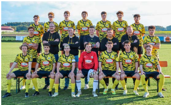
Gemeinsam gekämpft, gemeinsam gewachsen - die TSV A-Jugend