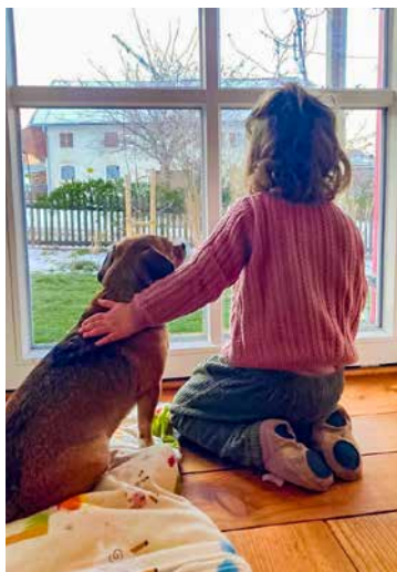
Hund Nali liebt die Kinder und sie lieben sie