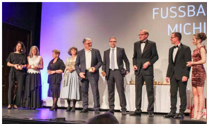
Die anwesenden Abteilungsleiter wurden wie die anderen Preisträger mit einem goldenen TSV Perchting-Hadorf-Wappen auf Holz ausgezeichnet