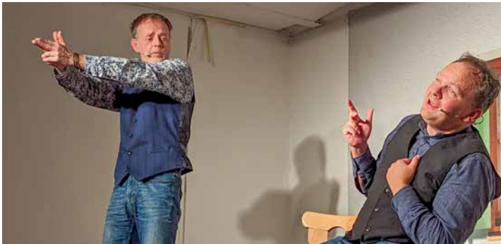
Auch eine wilde Schießerei durfte im Programm nicht fehlen

Nachdem sich zwei ungleiche Brüder an der Beerdigung des Familienoberhaupts nach mehr als zwanzig Jahren erstmals