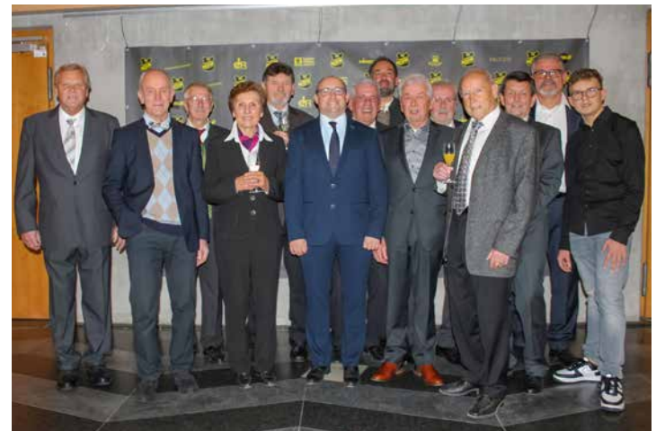
Fesche Perchtinger Stockschtützen