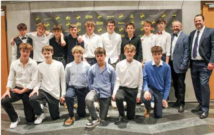
Die Jungs von der B-Jugend SG Söcking-Perchting unterstützten die Feierlichkeiten grandios