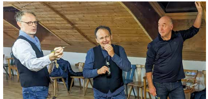
Nach der Show blieben die sympathischen Oberösterreicher noch auf eine Runde Dart mit den Organisatoren

Es war beeindruckend, wie BlöZinger mit zwei Stühlen eine abenteuerliche Achterbahnfahrt mitten hinein in die Gehirnwindungen des Publikums zauberte. Sie nennen das selbst: KopfKinoKabarett – das trifft es recht gut.