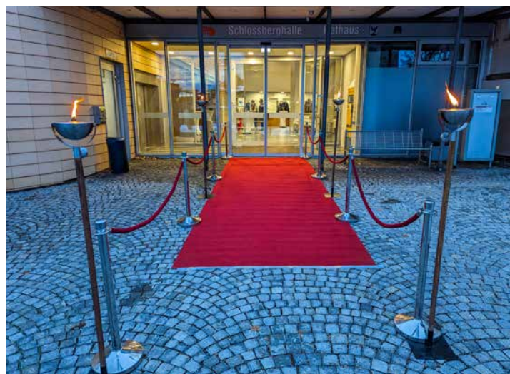
Die Besucher der TSV Vereins-Gala wurden standesgemäß empfangen

Betreiber der Schöneegger Käse-Alm in Unterbrunn. Was in der nächsten Zeit sonst für Termine bei uns anstehen, finden Sie wie immer auf der letzten Seite.