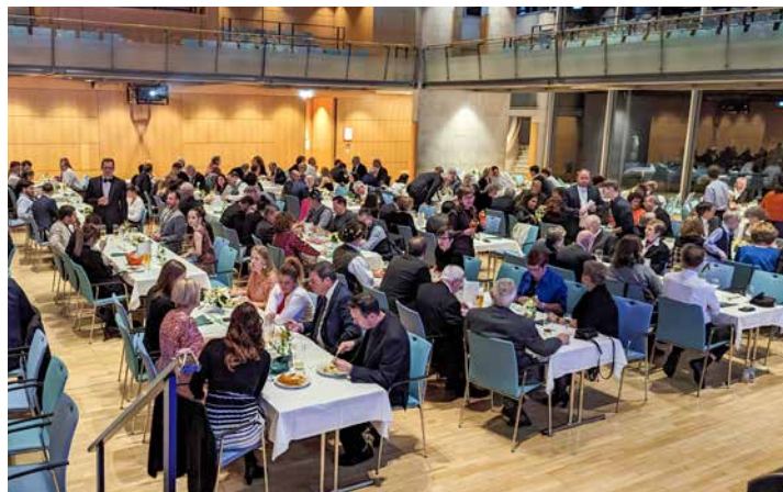
Die rappellvolle Starnberger Schlossberghalle