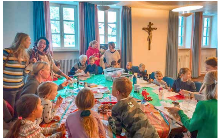
Zahlreiche Kinder und Eltern fanden sich zum Adventsbasteln im Pfarrheim Perchting ein