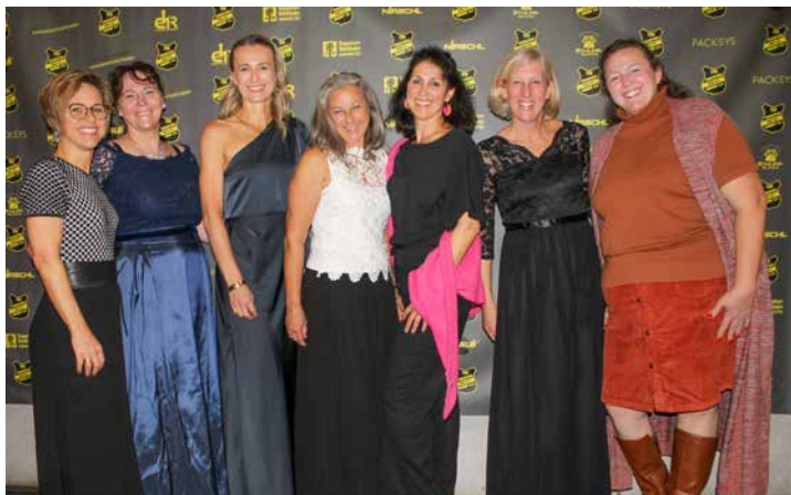
Die Gymnastik-Gruppe sorgte mit stilvoller Dekoration für das richtige Ambiente