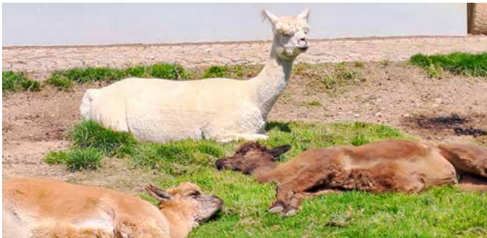
Bei dieser Hitze faule Alpakas auf dem Saliter-Hof

Auch denen war es zu heiß. Sie lagen alle ausgestreckt auf dem Stroh oder auf der Wiese im Schatten. Die Kängurus saßen