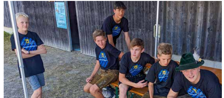
Ohne die Jungburschen ist das Festwochenende nicht mehr denkbar