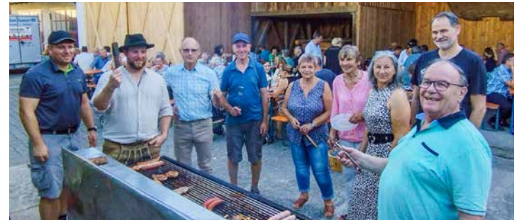
Gut gelaunte Grillerinnen und Griller beim Dorffest in Perchting

Am 18. August fand das traditionell vom Obst- und Gartenbauverein organisierte Perchtinger Dorffest im Zerhoch-Hof statt. Bei Traumwetter wurde gegrillt, geratscht und die ein oder andere „Hoibe“ genossen. (sf)