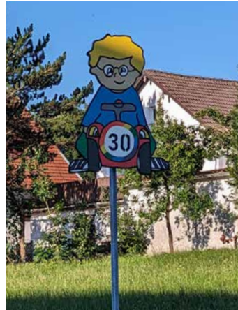
Auch dieser Bobbycar-Fahrer ruft zum Langsamfahren auf