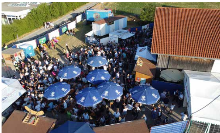
Der Außenbereich des Stadtfests von oben