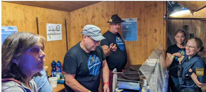
Am Kaffee- und Crêpes-Stand wird nicht nur die Polizei versorgt