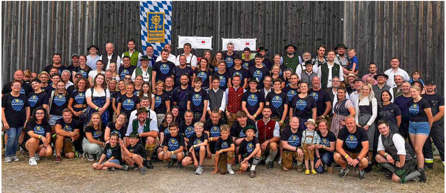
Die Burschenschaft Perchting mit ihrem Helfer-Team vor dem Dosch-Stadl