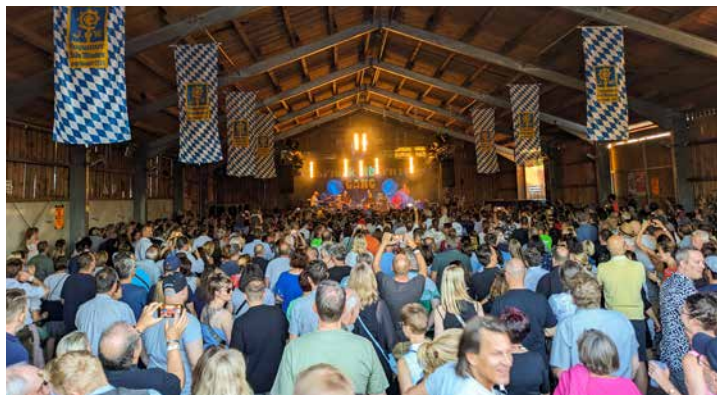
Rock'n Roll im vollen Dosch-Stadl

„Von anderen Veranstaltungen hört man teils über viel Widerstand der Anwohner. Bei uns kommen die Leute einfach und feiern mit. Das macht unsere Dörfer aus!“, freut sich der erfahrene Vorstand der Perchtinger Burschenschaft. Für das „Spider-Konzert“ am 7. Juli hätte man wohl doppelt so viele Karten verkaufen können, aber mit 1.000 Gästen war der Stadl bereits gut gefüllt und mehr „...ging einfach nicht...“.