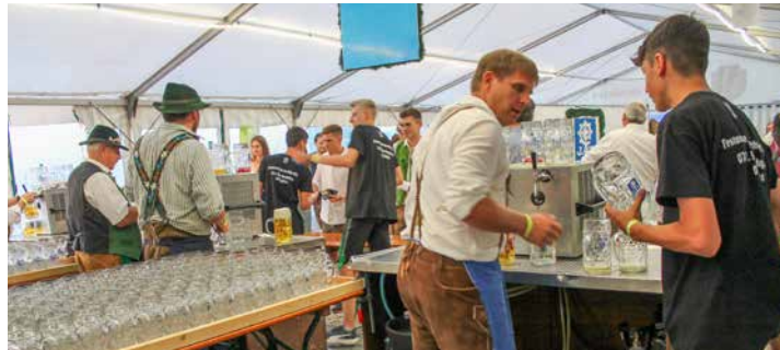
Alt- und Jungburschen helfen zusammen, wie hier am Ausschank