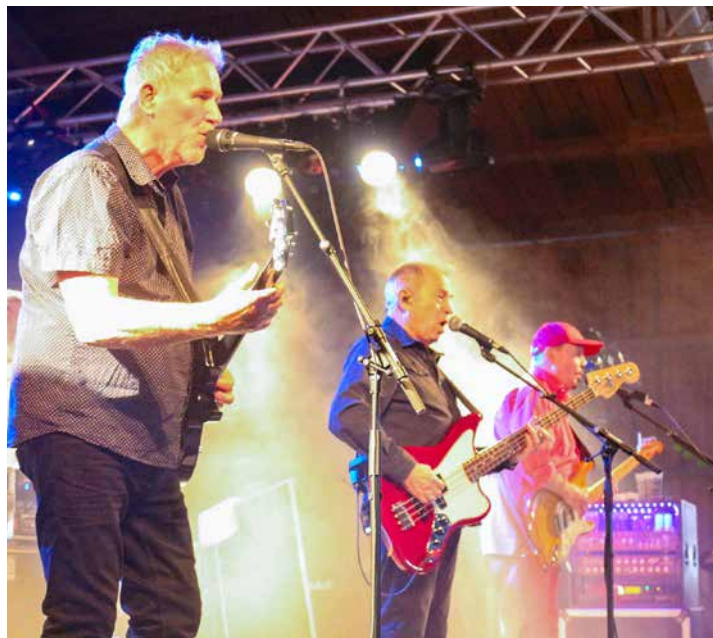
Die Spider Murphy Gang in Action