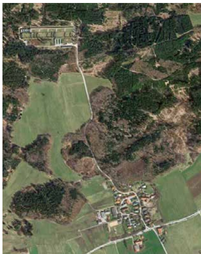
Streitpunkt in Landstetten: die nördliche Standort-schießanlage

Für unsere drei Dörfer gilt die Beibehaltung des Schulbus-systems für die Grundschüler, nachdem nach der Wiedereinführung vor zwei Jahren im Stadtrat erneut der Antrag auf Abschaffung der Schulbusse gestellt wurde.