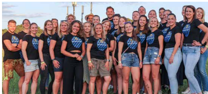
Das Bar-Team ist bereit für den Ansturm der Gäste