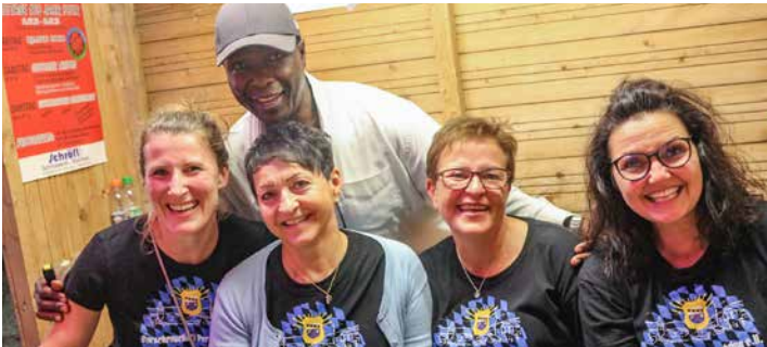
Eines der Kassenteams – gut geschützt von einem Security