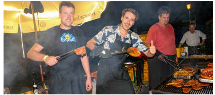
Haben alles fest im Griff – das Team am Grill