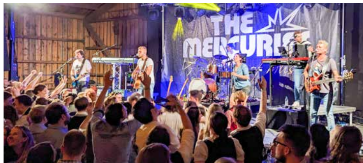
The Mercuries sorgen für noch höhere Temperaturen im Dosch-Stadl