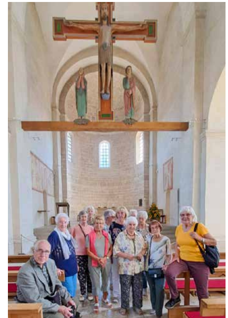
Etwas Abkühlung gab es beim Besuch der Basilika St. Michael

Anschließend fuhren wir nach Altstadt und besichtigten die die romanische Basilika St. Michael. Im Kirchenraum fällt ein riesiges Kreuz auf, mit Maria und Johannes. Dieser Christus wird „der Große Gott von Altstadt“ genannt.