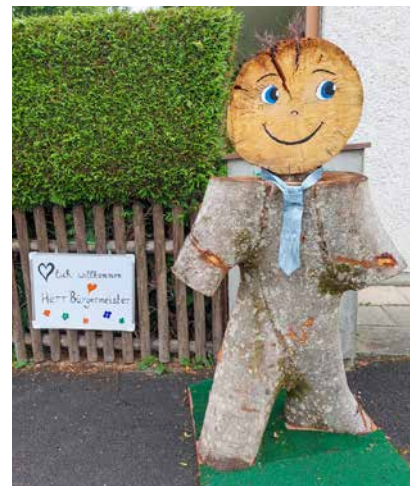
Das neue Perchtinger „Manschgerl“ begrüßt den Bürgermeister zur Ortsteilversammlung

Am 11. Juli ging es in Perchting zuerst um den Dauerbrenner, die alte Schule bzw. den ehemaligen Kindergarten. Dieser wird jetzt für die nächsten Jahre seiner eigentlichen Bestimmung zugeführt und interimswise als Kindertagesstätte einer Starnberger Einrichtung genutzt. Mögliche spätere Alternativnutzungen sollen dann im Rahmen einer Bürger-versammlung erörtert werden. Ein breiter Konsens zeichnete sich bei der Beibehaltung der Tempo 30 Zone und damit auch der rechts vor links Regelung