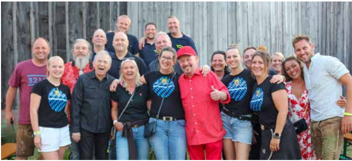
Die Band tritt auch hinter den Kulissen sehr sympathisch auf