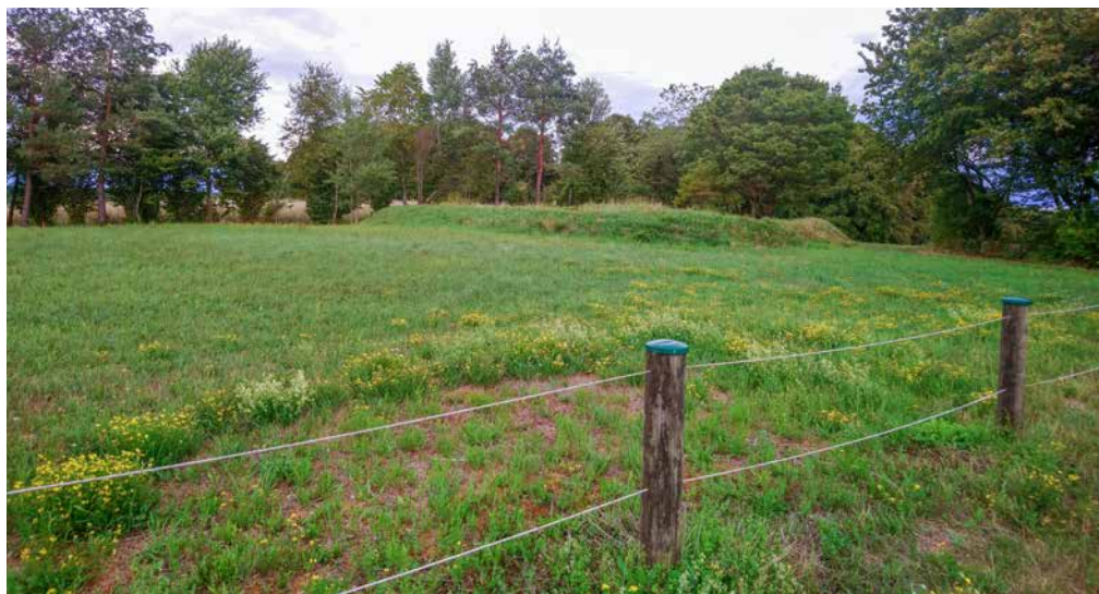
Die Streuobstwiese mit Blick auf den Grillplatz

Der Obst- und Gartenbauverein Perchting plant auf dem südlich gelegenen Wiesengrundstück, oberhalb vom „Nirschl“ die Neu- anlage einer Streuobstwiese mit zwölf Obstbaumhochstämmen. Geplant sind nur alte Sorten von Walnuss-, Zwetschgen- und verschiedenen Apfelbäumen. Ein Zuwendungsbescheid in Höhe von 650 Euro des Amtes für „Ländliche Entwicklung Oberbayern“ liegt vor und so dürfte die Pflanzung der Hochstämmen, falls der Verein noch kurzfristig Bäume erhält, bereits im September oder Oktober erfolgen. Hierzu sucht der Verein noch tatkräftige Helferlein, die bei der Vorbereitung und Anlage sowie Unterhalt