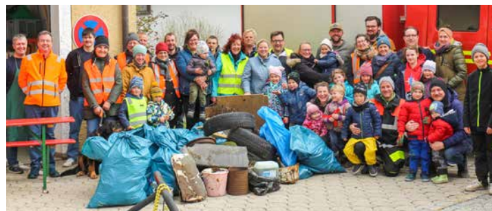
Die fleißigen Perchtinger um den gesammelten Müllberg

Wieder einmal beweist Perchting den tollen Zusammenhalt im Dorf. Insgesamt 73 fleißige Helfer von klein bis etwas älter, kamen am 1. April bei der Feuerwehr in Perchting zusammen, um im und um das Dorf die Hinterlassenschaften anderer wegzuräumen. Leider kein Aprilscherz war einmal mehr die erschreckende Menge an Müll, die oft achtlos, aber mit voller Absicht in der Natur deponiert wurde. Rund 2 Kubikmeter nicht-verrottender Abfall wurden auch dieses Jahr wieder eingesammelt. Dabei wurden 6 Autoreifen, einige Autoteile, eine Fensterscheibe und sogar ein Kanister mit Altöl aus der Natur entfernt. Für alle Helfer gab es im Anschluss eine Brotzeit – wie so oft perfekt organisiert von der Feuerwehr. (Marc Berger)