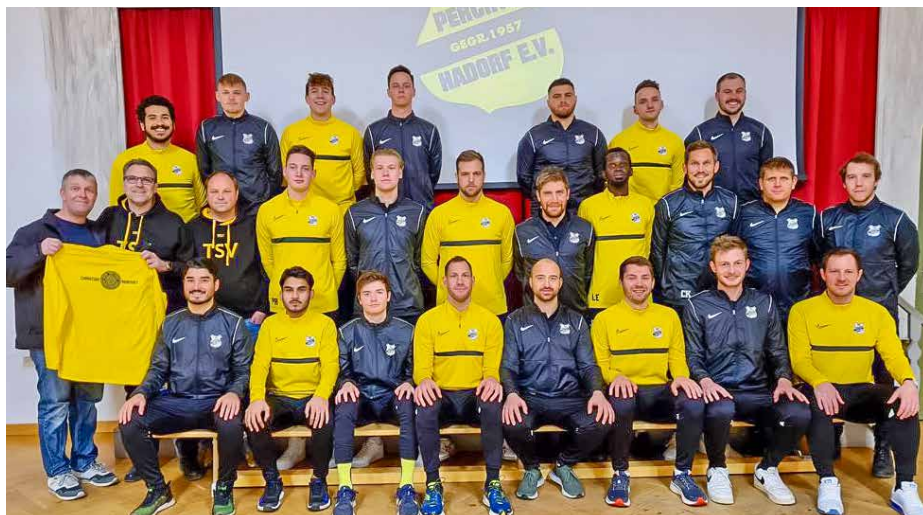
Sind gut vorbereitet: Die Fussball-Herren des TSV

selten besser.“, freut sich Abteilungsleiter Michael Kuch. Bevor die Abstiegsrunde gestartet wurde, gingen die Leistungen der ersten Saisonphase in die Wertung ein. Die Viertplatzierten starten mit 6 Punkten, unsere Erste ging nach dem Erreichen des vorletzten Tabellenplatzes vor dem 1. Spieltag Ende März mit einem Punkt ins Rennen. Zu unserem Redaktionsschluss ist unsere 1. Mannschaft mit einer sehr unglücklichen Niederlage und einem Sieg mit 4 Punkten auf Platz 4. Unsere 2. Mannschaft rangiert nach einer Niederlage und einem Unentschieden mit 3 Punkten auf Platz 5.