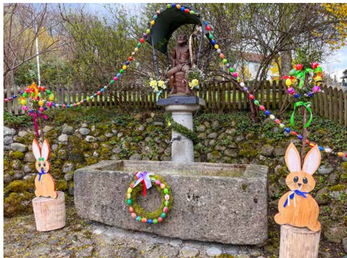
Mit viel Liebe wurde der Hadorfer Dorfbrunnen geschmückt

ein neuer Wirt im Vereinsheim. Alle anstehenden Termine finden Sie wie immer auf der letzten Seite. Wir wünschen Ihnen viel Spaß beim Lesen!