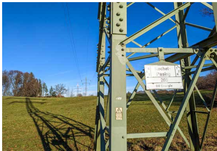
Die östlichste und älteste Trasse der Deutschen Bahn

Die Einspeisung von Energie erfolgt u.a. am Walchenseekraftwerk. Im Walchenseekraftwerk wird neben Drehstrom für die