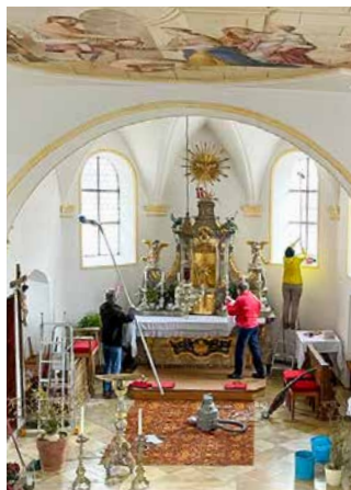
Die Hadorfer Kirche bekommt einen Frühjahrsputz

Groß und Klein trafen sich am Ende März am Hadorfer Kirchplatz zum Ramadama. Rund ums Dorf wurde fleißig geklaubt und gesammelt. Auch der Mesner freute sich über die Putzkolonne, die bei der jährlichen Großreinigung der Kirche unterstützte. Nach getaner Arbeit bedankte sich der Hadorfer Gartenbauverein bei den fleißigen Helfern mit einem Mittagessen. (Gertraud Küchler)