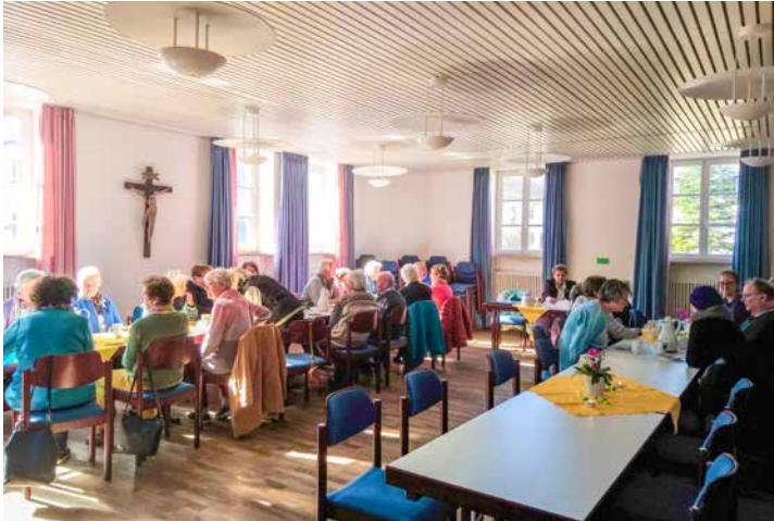
Gut besucht war die Jahreshauptversammlung des Perchtinger Gartenbauvereins

Knapp 30 Mitglieder durfte der Vorstand des Obst- und Gartenbauvereins am 25. März zu seiner Jahreshauptversammlung begrüßen. Dabei gab es einige erfreuliche Nachrichten zu besprechen.