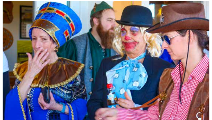
Viele tolle und teils aufwendige Kostüme waren zu sehen