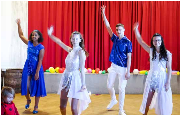
Der Auftritt der Pöckinger Kindergarde war ein Highlight