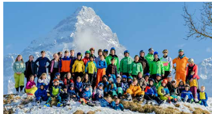
Strahlender Sonnenschein für die TSV-Truppe bei den Ski-Vereinsmeisterschaften