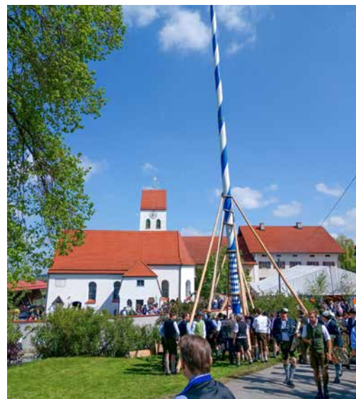
Wie zuletzt 2019 wird der Hadorfer Maibaum traditionell aufgestellt

Das Stadtfest findet am 27. Mai ab 19 Uhr statt. Einlaß ist ab 16 Jahren. Es spielt die Partyband Pitch Black und es gibt einen Barbetrieb begleitet von DJ Dashgod. Zum Essen gibt es Gegrilltes und die beliebten Hadorfer Rollbratensammeln.