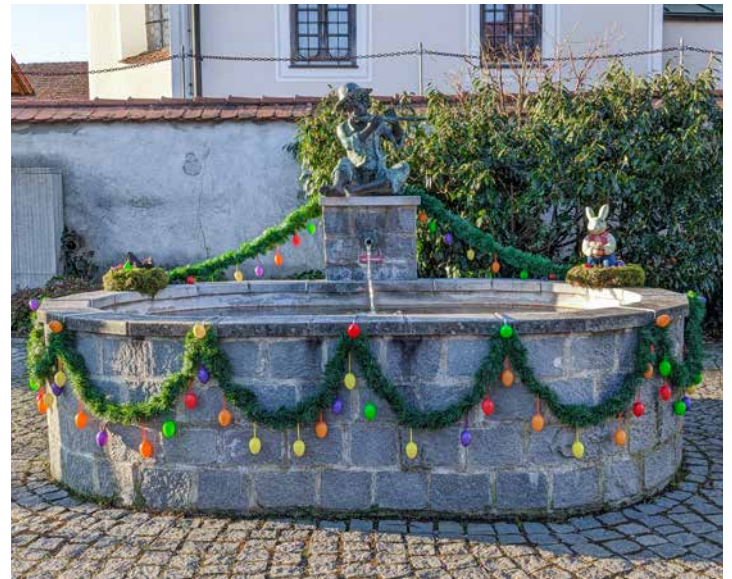
Bunt geschmückt zeigt sich der Perchtinger Dorfbrunnen in der Osterzeit

Von diesen positiven Entwicklungen profitiert das ganze Dorf durch die kreativen Aktivitäten des Vereins. Zuletzt wurde der Dorfbrunnen österlich geschmückt. Weiter so! (sf)