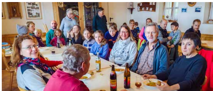
Nach getaner Arbeit haben sich die fleißigen Hadorfer eine Stärkung verdient