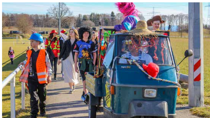
Der kleinste Faschingswagen der Welt - die Perchtinger Ape mit roter Nase

Rund 200 mehr oder weniger verkleidete Kinder und Erwachsene waren dabei. Der Umzug begann, angeführt vom wahr- scheinlich kleinsten Faschingswagen der Welt, am Pfarrheim.