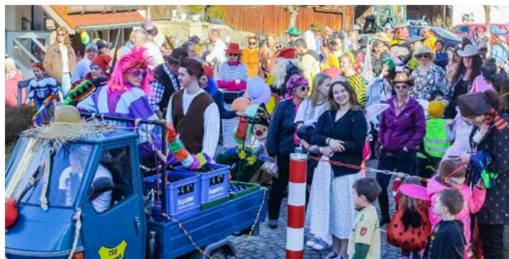
Versammlung zum Umzug am Pfarrheim

Rund 200 mehr oder weniger verkleidete Kinder und Erwachsene waren dabei. Der Umzug begann, angeführt vom wahr- scheinlich kleinsten Faschingswagen der Welt, am Pfarrheim.