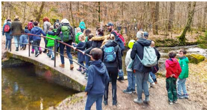
Kommunionkinder auf dem „Glaubensweg“ durch die Maisinger Schlucht

Auch die zwölfköpfige Gruppe der Kinder aus Perchting, Hadorf und Landstetten hat sich in den vergangenen Wochen in Gruppenstunden unter anderem mit Sakramenten und der Bibel, mit Jesus und sich selbst beschäftigt. Sie besuchten Gottesdienste, inspizierten ihre Dorfkirche, nahmen an einer Glaubens-Rallye teil, banden Palmbuschen und durften ihre Kommunionkerzen