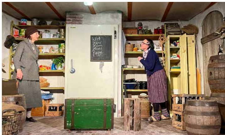
Mucki und Maudi ermitteln angestrengt

Eine Besonderheit war im Jahr 2023 die Bewirtung. Da es zum Zeitpunkt der Aufführungen keinen Wirt gab, haben die anderen Abteilungen des Vereins die gastronomische Betreuung unter sich aufgeteilt. So waren beispielsweise die Stockschützen