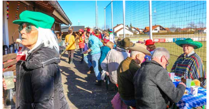
Das bunte Faschingstreiben im Vereinsheim hat einfach nur Spaß gemacht

Vielen Dank allen beteiligten Organisatoren und Helfern, dass ihr das endlich in die Hand genommen habt! (sf)