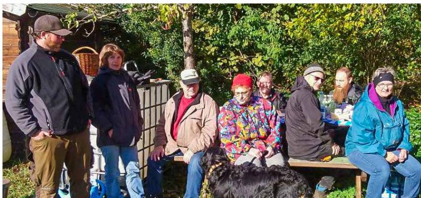
Verdiente Pause nach getaner Arbeit: Die Helfer bei der Pflanzaktion

versehen und die Bäume anzubinden und somit sturm- und windfest zu machen. Nach getaner Arbeit ließen sich die Helfer die bereitgestellte, redlich verdiente Brotzeit schmecken.