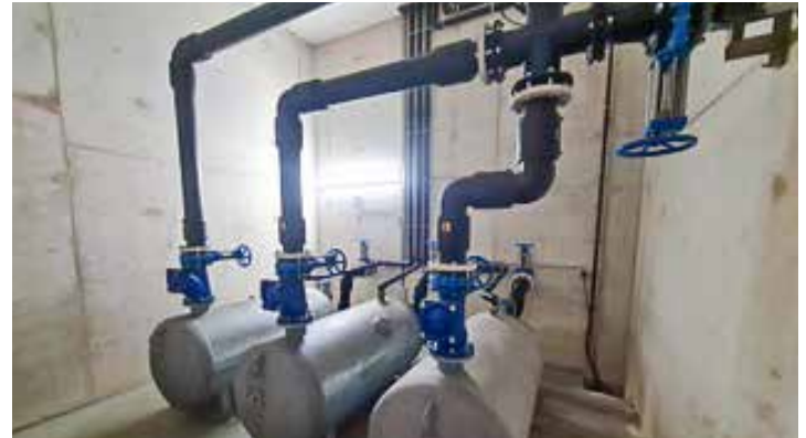
Innenaufnahme vom Pumpenhaus in Perchting

Das Schmutzwasser wird über die Ortskanäle zu den Pumpenhäusern an der Andechser Straße (Perchting) und der Uneringer Straße (Hadorf) geleitet und dann über Druckleitungen entlang der Straßen nach Söcking gepumpt. Die Übergabepunkte liegen nahe des Kreisverkehrs bzw. an der Hadorfer Straße in Söcking. In Landstetten ist die Situation noch so wie in Perch-