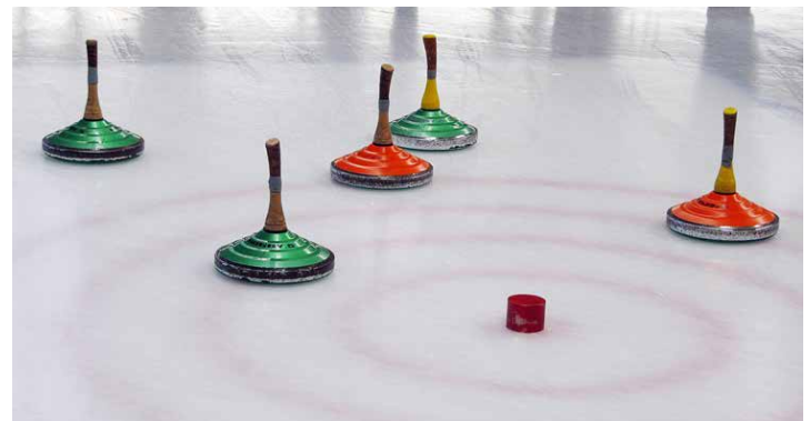
Unsere Männer waren meistens näher am Ziel und konnten erst im Aufstiegs-spiel gestoppt werden