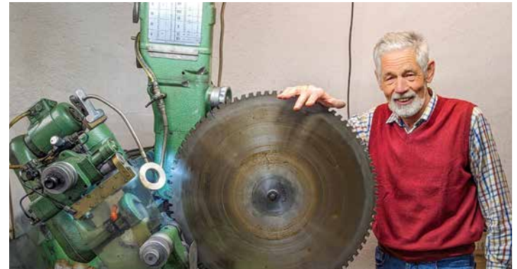
Die Zähne seiner Schleifblätter hat der Bastler nach Abnutzung selbst repariert

chen Messer, Ketten, Sägeblätter und vieles mehr schleifen. Ungefähr drei Viertel seines Geschäfts lief über Handwerksbetriebe wie Zimmereien und Gartenbauer, aber auch Metzgereien und Köche zählten zu seiner Kundschaft. „Bei den Privatkunden warn’s sicher 100 Heckenscheren und etliche hundert Ketten im Jahr, die i g’schliffa hob“. Die Maschinen bleiben erstmal stehen und die ein oder andere wird sicherlich auch nochmal laufen. „I woas no ned wos i sog, wenn mi oaner nett fragt“, schmunzelt der sportliche Rentner.