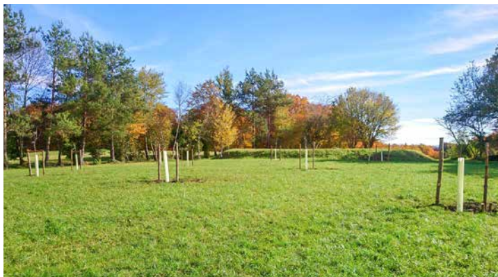
Die fertig bepflanzte Streuobstwiese oberhalb von Renault Nirschl

Der Obst- und Gartenbauverein Perchting hat das Grundstück oberhalb vom Nirschl mit elf jungen, hochstämmigen Streuobstbäumen bepflanzt. Darunter drei Zwetschgen- und sieben Apfelbäume sowie einen Birnbaum.