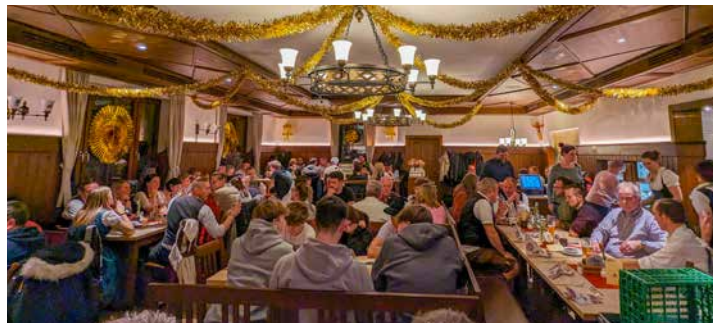
Die Gaststube Högner war fest in Perchtinger Hand

So beeindruckend, wie die Feste unserer Burschenschaft, war auch das Helferfest organisiert. Am frühen Nachmittag ging es nach Rothenfeld. Dort wurden die Teilnehmer in gemischte Gruppen eingeteilt und es wurde teils im Einzel, teils Bahn gegen Bahn als Gruppe gegeneinander auf die Kegel geworfen. Alle Beteiligten hatten eine Riesengaudi.