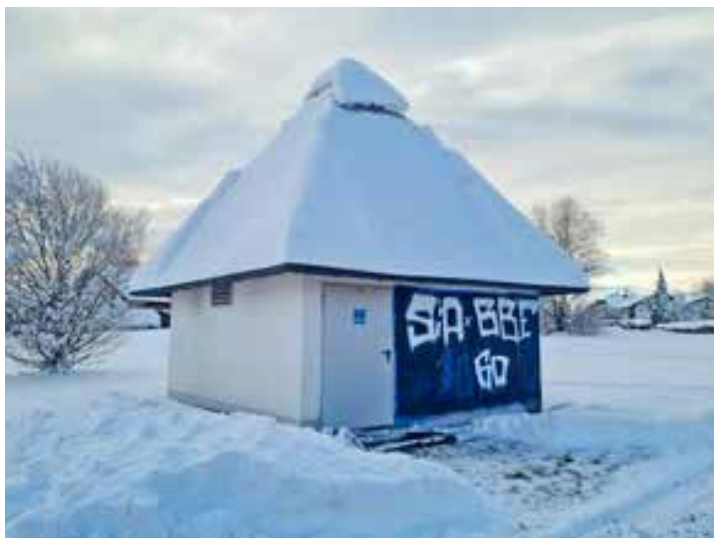
„Verzierte“ Außenansicht vom Pumpenhaus in Perchting

Sie haben eine Oberflächenstruktur wie Klett, nur im Mikrobereich. Dadurch kleben sie zusammen und können innerhalb des Grundstücks die Leitungen verstopfen. Es kam aber auch schon zu so großen Verklumpungen, dass die Tücher Pumpen zerstörten. Dadurch entstehen erhebliche Kosten und andere wichtige Arbeiten bleiben durch den Austausch der Pumpen liegen. Auch Fette z.B. aus Fritteusen sind ein Thema, weil sie Betonbauteile an Leitungen und Schächten in kürzester Zeit zerstören. Im Sinne der Beitragstabilität sollten diese Punkte beachtet werden.