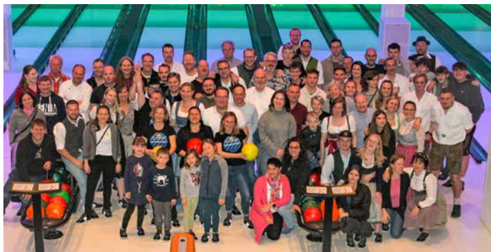
Die Teilnehmer des Helferfests auf den Bowling Islands

Ein Rundum-sorglos-Paket bot die Burschenschaft Perchting den gut 80 Teilnehmern beim Helferfest am 3. Februar. Zuerst ging es auf die Bowling Islands in Rothenfeld, anschließend wurde im Gasthaus Högner in Unterbrunn geschlemmt.