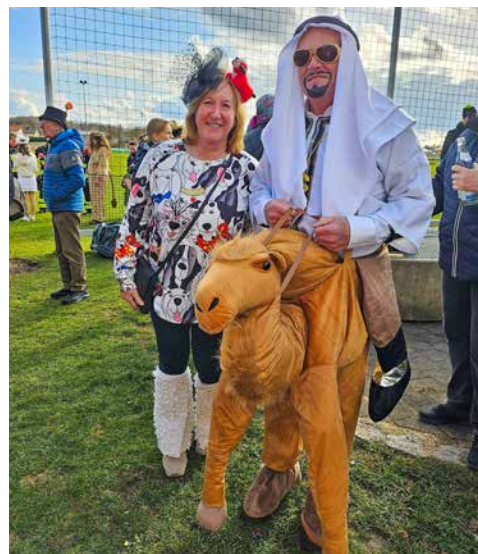
Perchtinger Fasching: Ob Scheich Bartl der neue Investor bei 1860 München wird?

Wir wünschen Ihnen viel Spaß beim Lesen!