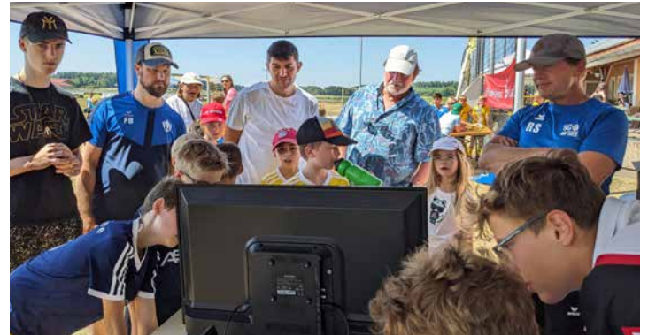
Am Wochenende 22.-23. Juni können Kinder und Zuschauer wieder beim Soccer-Cup mitfiebern

Es gibt allerdings auch Positives zu vermelden. In einem Gespräch der Abteilungen beider Vereine wurden die Wogen geglättet. Die Spieler des TSV Perchting-Hadorf bekommen bis zum Ende der laufenden Saison (Juli) eine freie Mitgliedschaft beim SV Söcking. Im Gespräch hat der SV Söcking in Aussicht gestellt, dass die Kinder aus unseren Dörfern als Gastspieler in den jeweiligen Mannschaften spielen dürfen. Das heißt, die Kinder können beim TSV Mitglied bleiben und beim SV Söcking spielen. „Das Gespräch mit den Söckinger Vertretern war wohl das beste, das wir in der letzten Zeit geführt haben. Dieses reinigende Gewitter war vielleicht nötig, um einen neuen Anfang zu