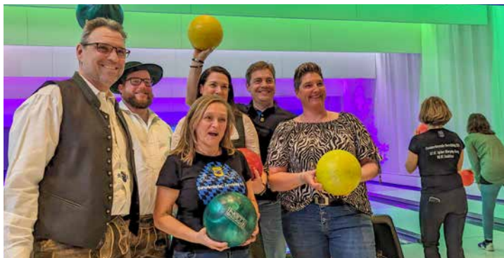
Die bunt gemischten Teams hatten richtig Spaß beim bowlen

So beeindruckend, wie die Feste unserer Burschenschaft, war auch das Helferfest organisiert. Am frühen Nachmittag ging es nach Rothenfeld. Dort wurden die Teilnehmer in gemischte Gruppen eingeteilt und es wurde teils im Einzel, teils Bahn gegen Bahn als Gruppe gegeneinander auf die Kegel geworfen. Alle Beteiligten hatten eine Riesengaudi.